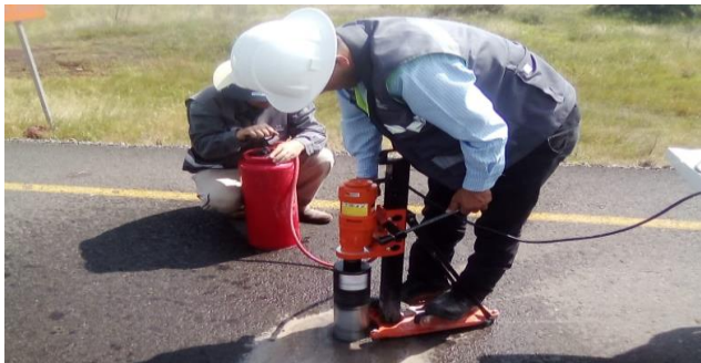
Ilustración 1. Extracción del espécimen.

En las ilustraciones 1 y 2 se muestra la extracción de especímenes en la carpeta asfáltica del camino 8, en los cadenamientos 0+100, 0+500 y 0+800, para determinar sus características.