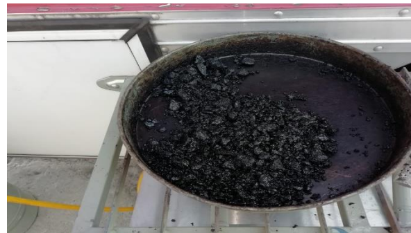
Ilustración 4. Preparación del espécimen de asfalto.