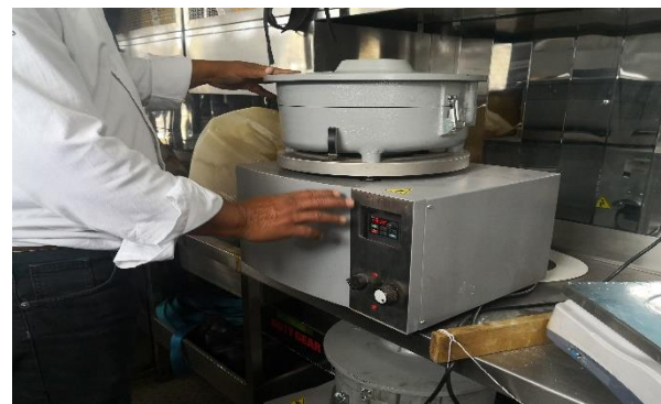
Ilustración 6. Determinación del contenido asfáltico.

En la ilustración 7 se aprecia la determinación del análisis granulométrico.