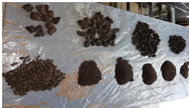
Ilustración 7. Determinación del análisis granulométrico.

En la ilustración 7 se aprecia la determinación del análisis granulométrico.