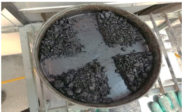
Ilustración 5. Cuarteo para obtener una muestra representativa del espécimen.

Después de disgregar el material y realizar el cuarteo se procedió a realizar el lavado de asfalto para determinar su contenido asfáltico, como se aprecia en las ilustraciones 5 y 6.