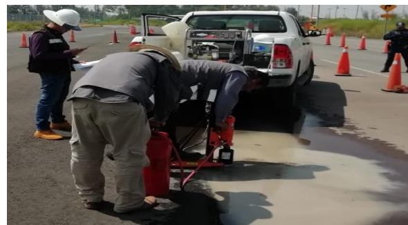
Ilustración 2. Muestra realizada sobre el camino 8.

En las ilustraciones 3 y 4 se aprecia la medición del espesor y preparación de la muestra para determinar su contenido asfáltico.