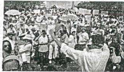
Futuro 21 y otros marcharán contra AMLO el 1