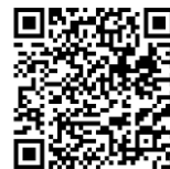
Infografía CENAPRED: “Qué onda con el calor”