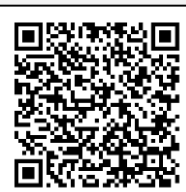
Infografía CENAPRED: "Tormentas eléctricas"