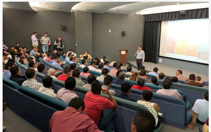
* Capacitación a personas servidoras públicas municipales del estado de Chiapas.

9. Brindamos capacitación a personas servidoras públicas municipales de 95 de los 125 municipios del estado de Chiapas sobre la Guía Consultiva de Desempeño Municipal.