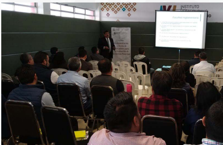
* Capacitación a servidores públicos municipales de la región norte del estado de Veracruz.

6. Brindamos capacitación a personas servidoras públicas de 50 municipios de la región norte del estado de Veracruz en materia de "Diseño de indicadores para la evaluación de la gestión municipal" y "Reglamentación", con el objetivo de fortalecer sus conocimientos teóricos y técnicos.