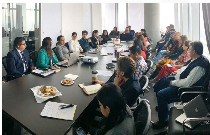
* Presentamos de la plataforma de Profesionalización del Inafed "Formate".

5. En el marco del convenio de colaboración entre la Secretaría de Gobernación y la Sedatu, presentamos nuestra plataforma de profesionalización "Formate", con el objetivo de trabajar de manera conjunta en la capacitación de las personas servidoras públicas municipales.