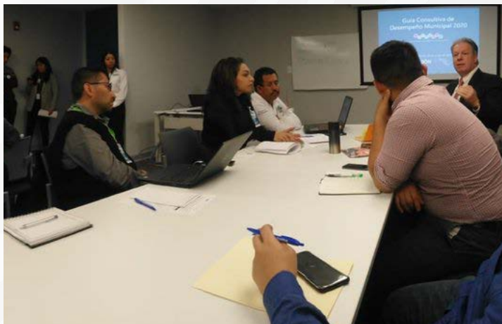
* Taller sobre el uso del Datamun y su funcionalidad.

4. Presentamos la Guía Consultiva de Desempeño Municipal e impartimos el taller sobre el uso del Datamun y su funcionalidad, a personas servidoras públicas municipales de los estados de Campeche, Chiapas, Hidalgo, Guanajuato, Puebla y Tabasco.