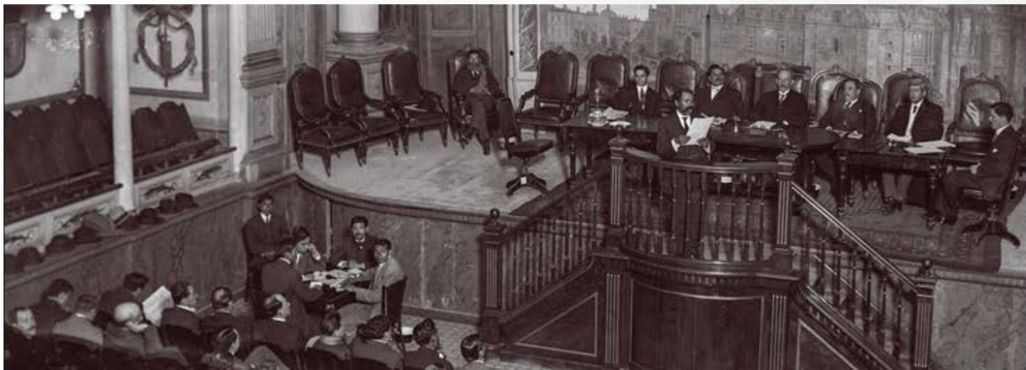
* Congreso Constituyente de 1917.

La idea del municipio libre inició a mediados del siglo XIX, en el Congreso Constituyente de 1856-1857, cuando el Diputado José María del Castillo Velasco instó a que la libertad municipal se consagrara en la nueva Constitución, sin embargo la propuesta no prosperó.