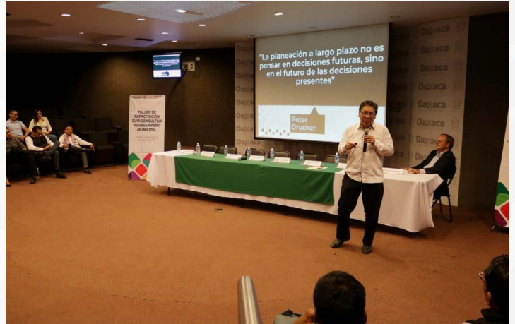
* Taller de capacitación a servidores públicos municipales del estado de Oaxaca.

7. Impartimos el taller de capacitación sobre la Guía Consultiva de Desempeño Municipal (GDM) a personas servidoras públicas de los 21 municipios del estado de Oaxaca que participan en la implementación de esta guía.