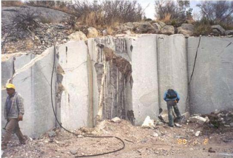
Banco de caliza marmorizada (mármol negro) en la Mina El Agua. Ejido la Negrita