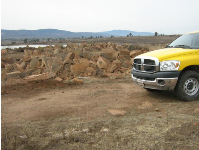
Panorámica de la Cantera La Lomita, Huichapan, Hidalgo.