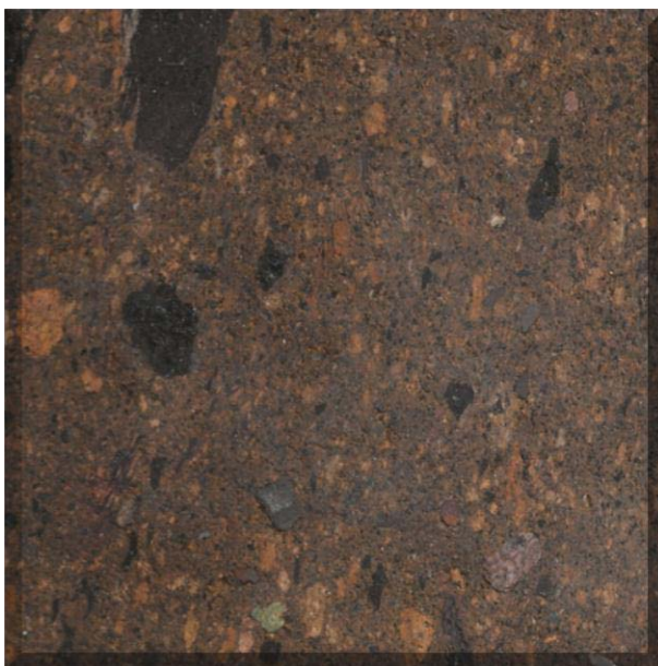
Mosaico laminado y pulido de ignimbrita color café claro, con abundantes fiammes de pómez color negro de hasta 5 cm de largo, presenta buen corte y no muestra aristas astilladas.