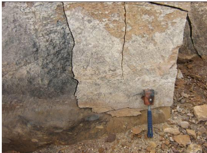
Detalle de la cantera La Lomita, Huichapan, Hidalgo.