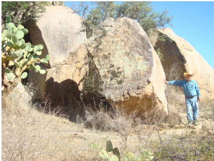
Detalle del prospecto La Hoya 1, donde se observan clastos angulosos de 5 m de alto, 4 m de ancho y espesor de 3 m, Municipio de Peñón Blanco, Estado de Durango.