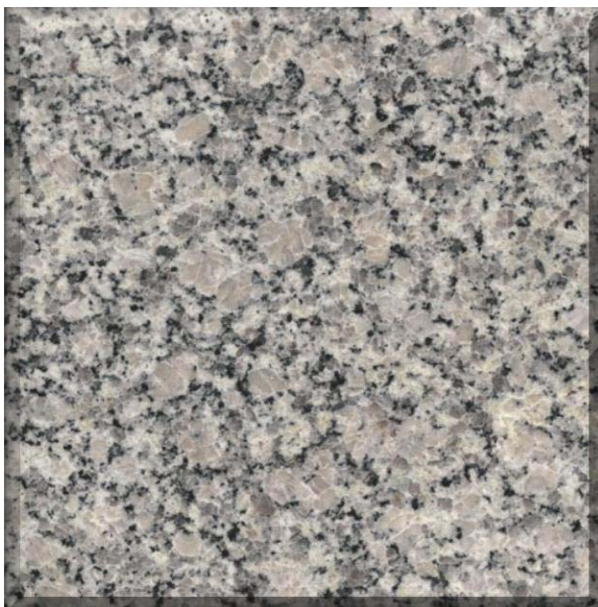
Mosaico laminado y pulido de granodiorita gris claro con puntos verdes a negro, presenta buena calidad de corte, aristas en buen estado y superficie tersa y pulida.