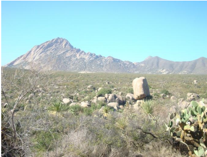
Panorámica del prospecto La Hoya 1, Municipio de Peñón Blanco, Estado de Durango.