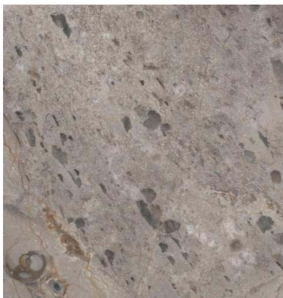
Mosaico de caliza fosilífera perteneciente a la Localidad El Capricho, Municipio Lerdo, Durango Muestra buenas características físicas de corte y pulido