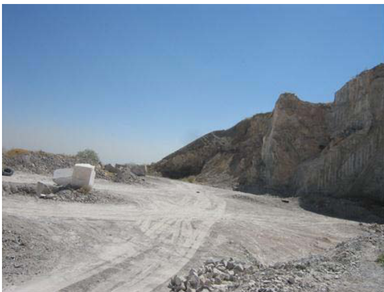
Panorámica de la cantera El Capricho, dentro del Ejido Puente La Torreña, Municipio Lerdo, Durango