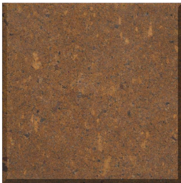
Mosaico laminado y pulido de ignimbrítica riolítica color amarillo ocre, con fragmentos de rocas volcánicas. La respuesta al corte es buena, presenta aristas sanas y buena apariencia estética..