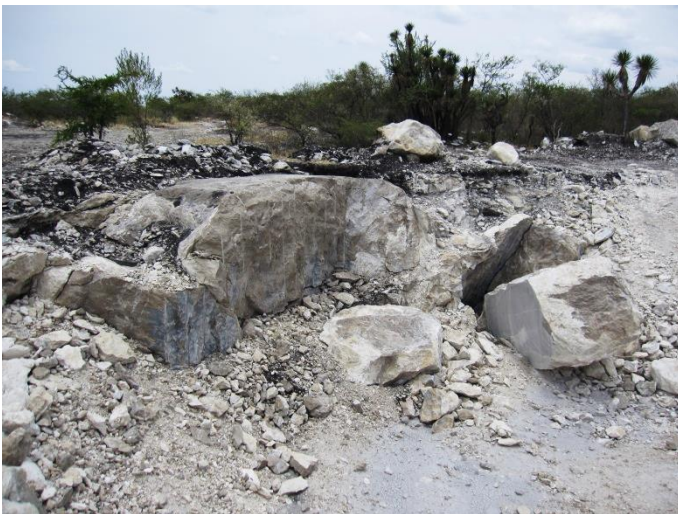
Acercamiento al tajo de caliza. Localidad Café Tabaco, Mpio. Tepexi de Rodríguez, Pue.