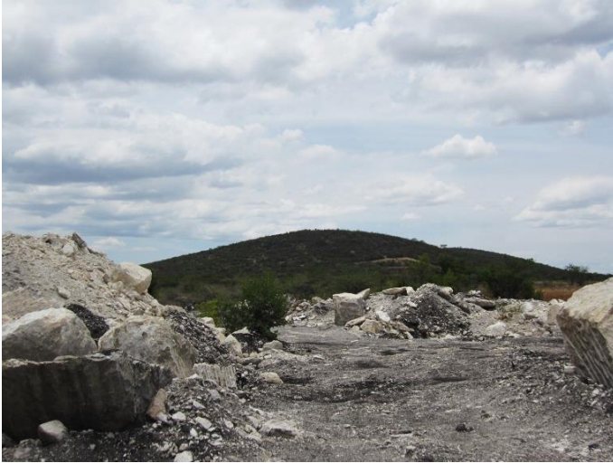
Panorámica parcial de la localidad Café Tabaco, Municipio Tepexi de Rodríguez, Pue.