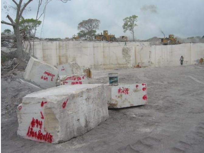
Frente de extracción de la Cantera El Delfín en el Mpio. Apazapan, Veracruz