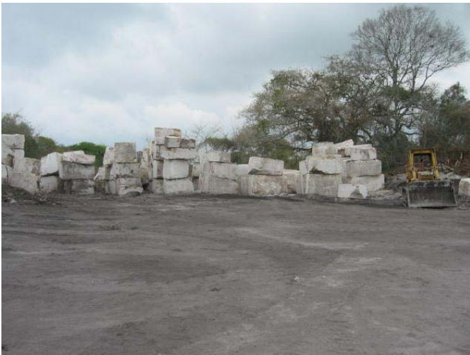
Bloques de Travertino de la Cantera El Delfín, Mpio. Apazapan, Veracruz.