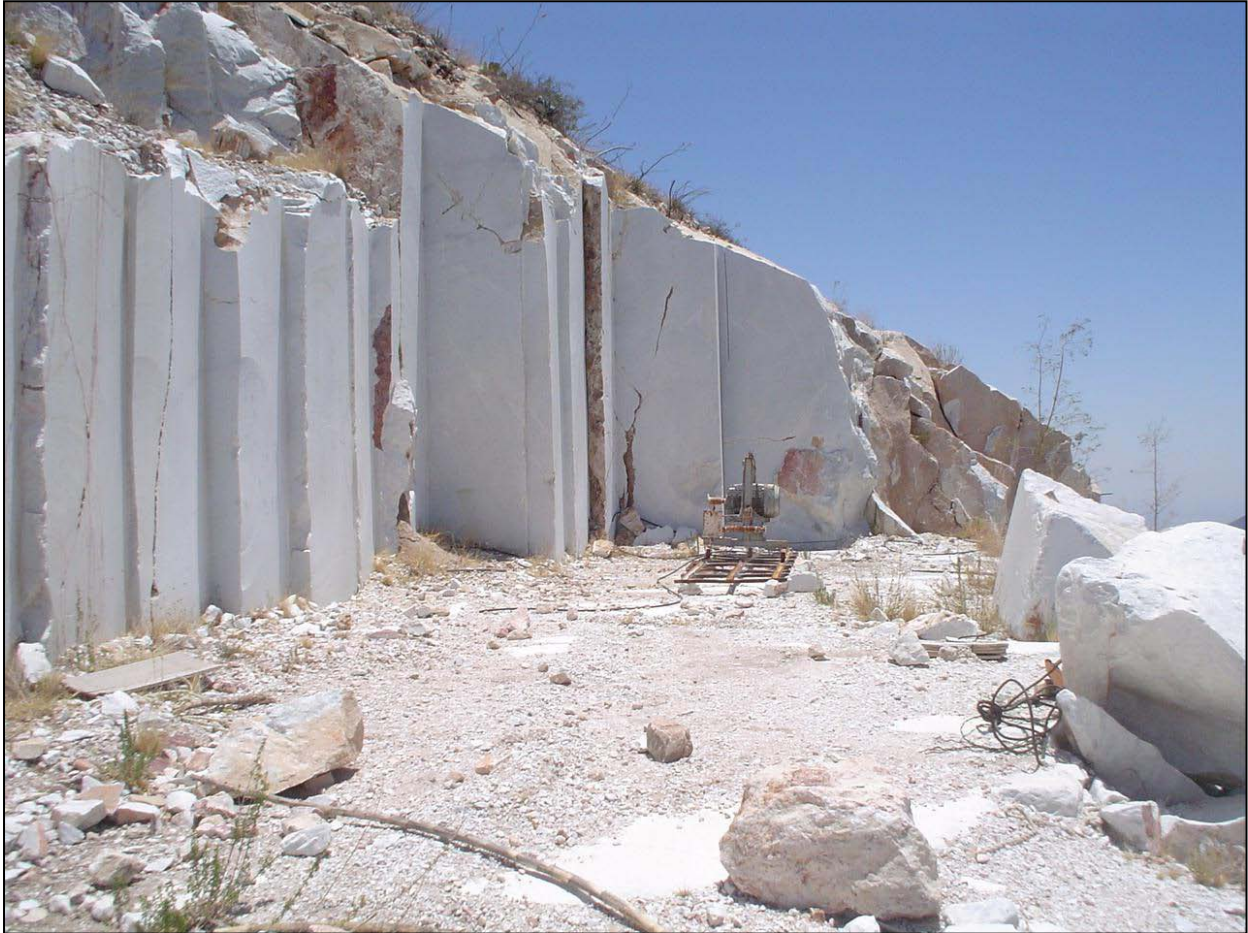
Zona marmolífera, localidad El Buitre