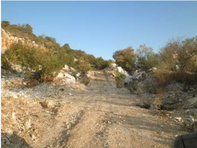
Panorámica y acceso al prospecto Cerro de Ixcateopan, Gro.