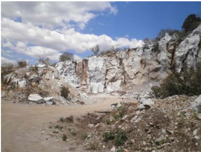
Vista frontal del afloramiento de mármol, en partes intemperizado y fracturado.