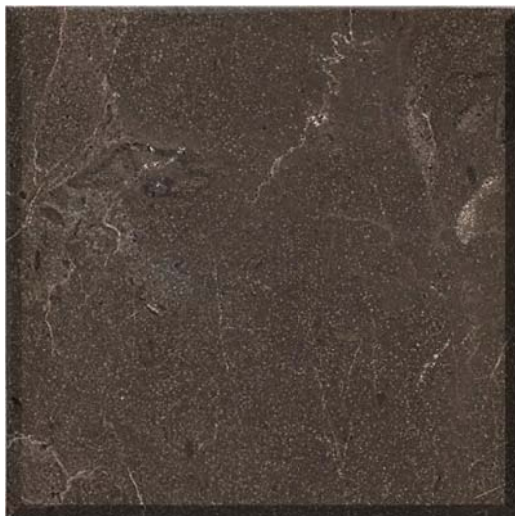
Mosaico pulido de la caliza color café oscuro, (tonalidad tabaco) de la localidad Cerro Cortado, Mpio., de Lerdo, Durango.