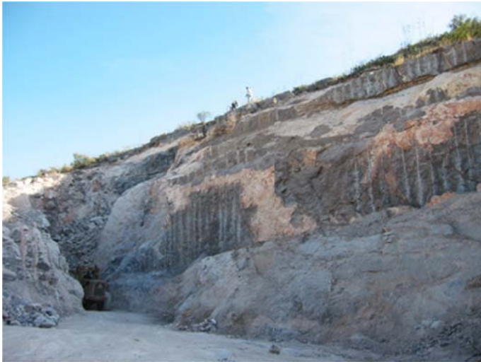
Banco de extracción de caliza color tabaco de la localidad Cerro Cortado, Mpio. de Lerdo, Estado de Durango.