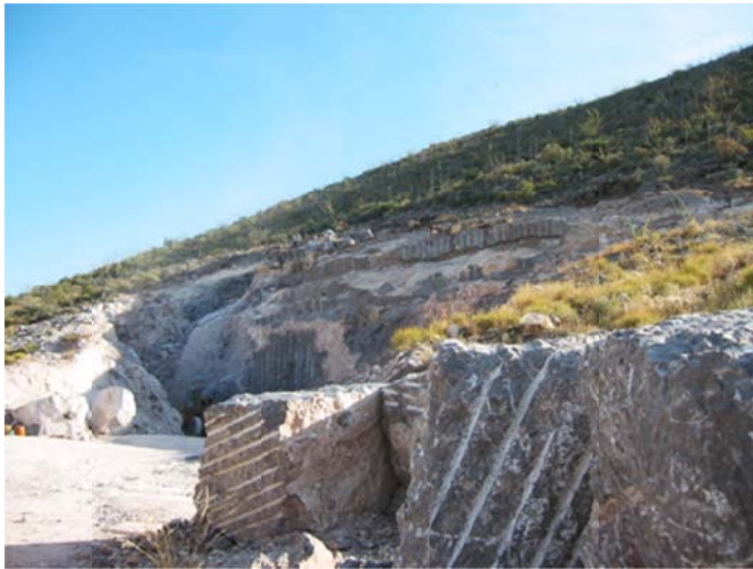
Bloques de caliza color café oscuro, (tonalidad tabaco) de la localidad Cerro Cortado, Mpio., de Lerdo, Durango.