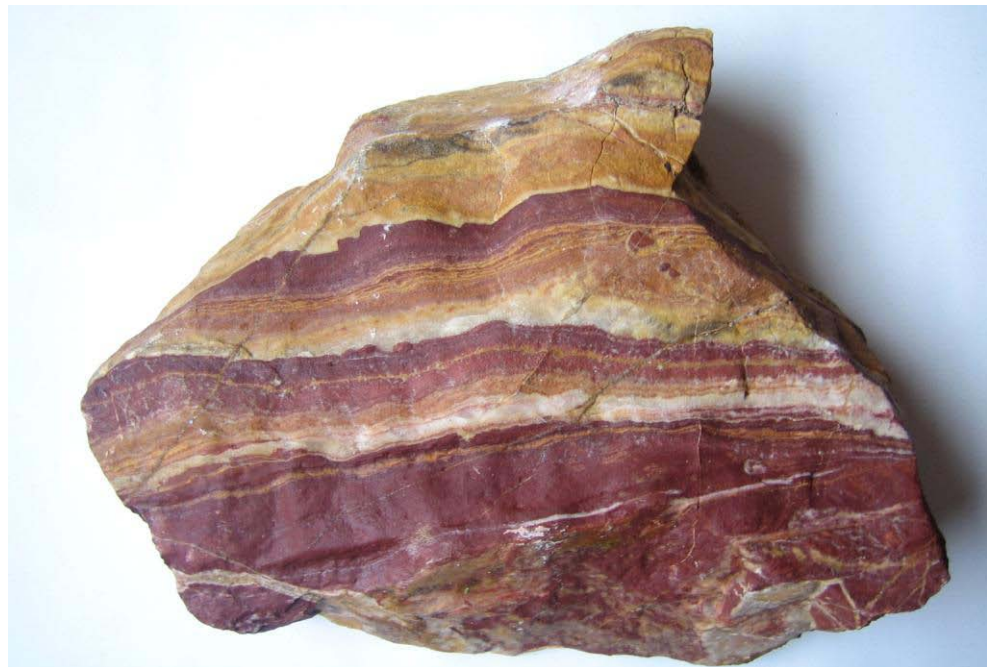
Localidad Cañón del Muerto. El ónix presenta bandas escaladas de colores rojo, amarillo, naranja y blanco. Puede ser utilizado en acabados ornamentales e industria de la construcción.