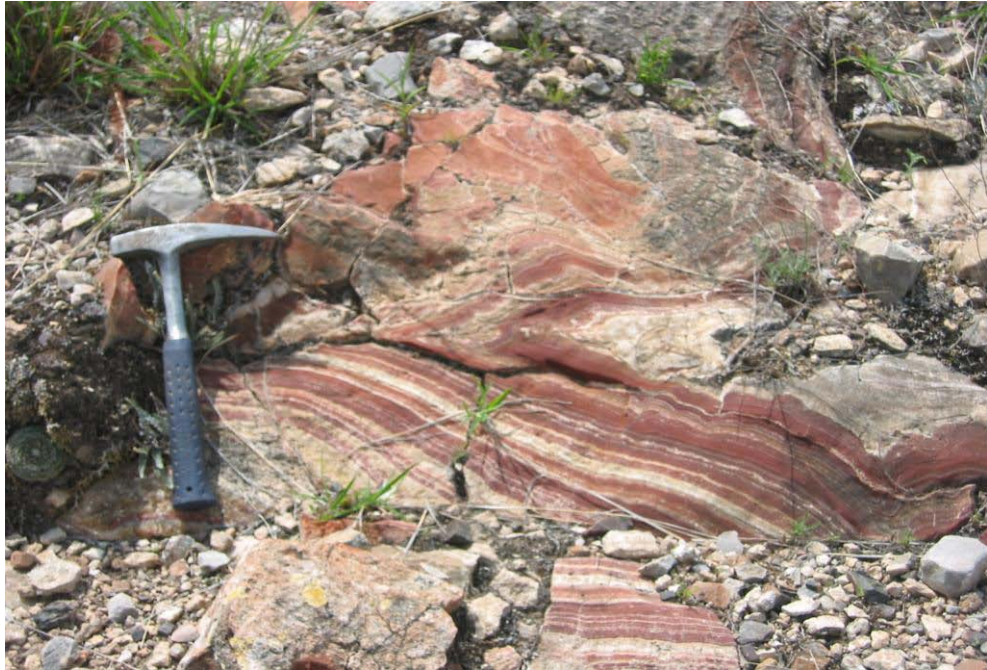
Localidad Cañón del Muerto. Cercamiento a un ornamento ónix bandeado. Destaca lo vistoso de las bandas rojas.