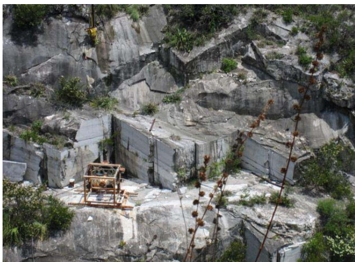
Detalle de la secuencia de las capas superficiales de mármol. Localidad Cañón de las Piletas II, Municipio San Carlos, Estado de Tamaulipas.