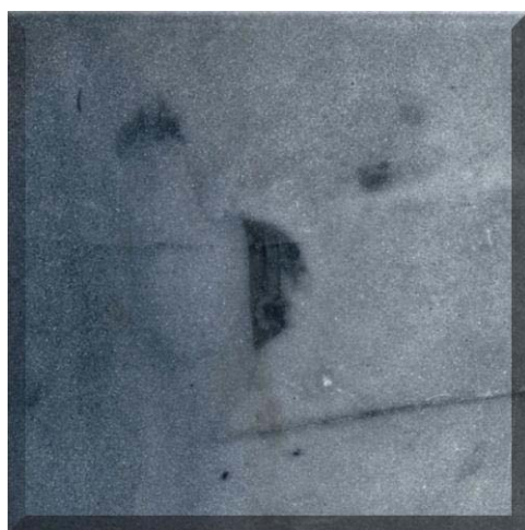
Cañón de las Piletas II