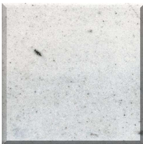
Cañón de las Piletas III