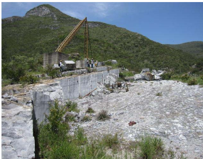
Panorámica del banco de mármol Cañón de las Piletas II, Municipio San Carlos, Estado de Tamaulipas.