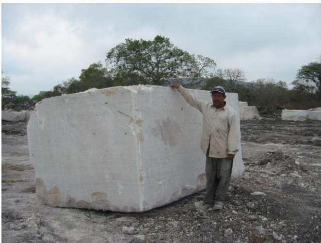
Acercamiento a un bloque de Travertino. Canteras Laguna, Mpio. Apazapan, Veracruz.