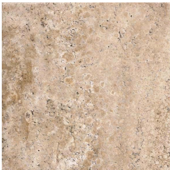
Vista de mosaico cortado, laminado y pulido