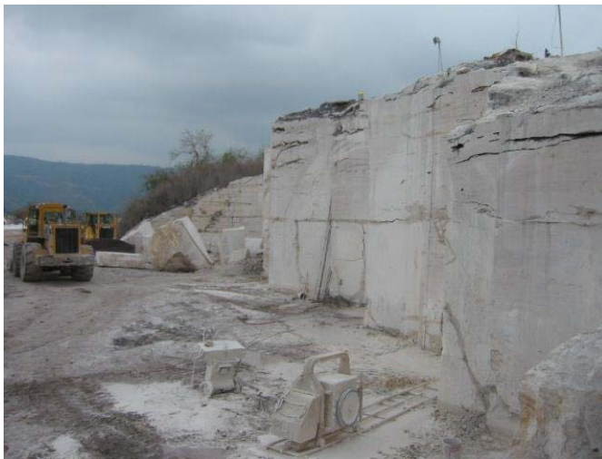
Frente de extracción de la Canteras de Travertino Laguna, Mpio. Apazapan, Veracruz.