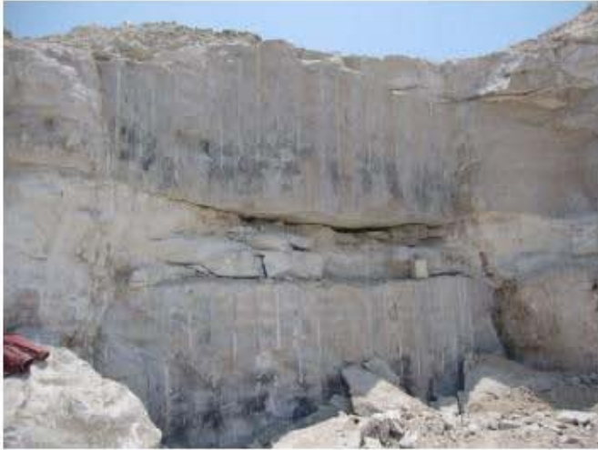
Frente de extracción de travertino en la localidad Banco Rojas.