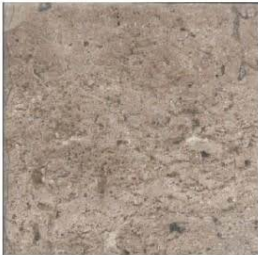
Mosaico cortado y pulido que muestra las buenas características físicas de brillo y pulido.