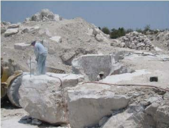
Bloques de travertino desprendidos con polvo expansivo y cortados con