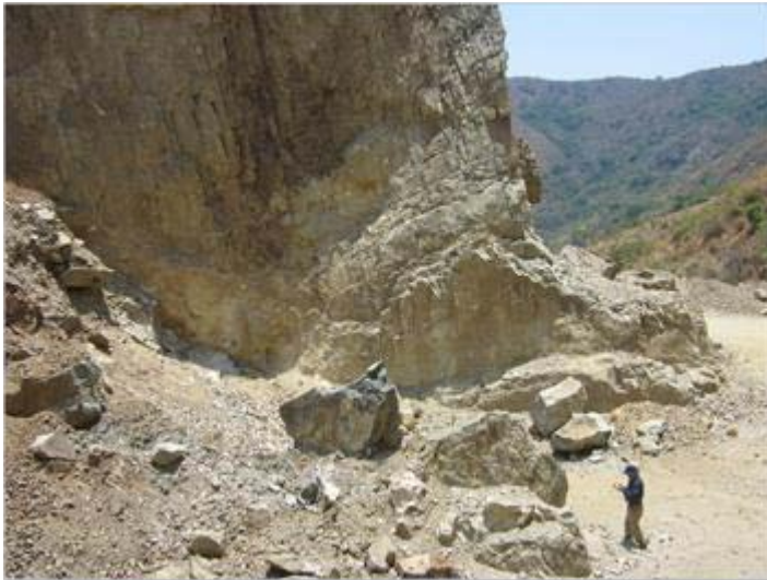
Detalle del banco de mármol Padilla, Tuxpan, Jalisco.