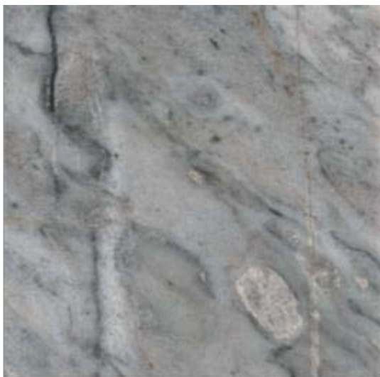
Mosaico pulido de mármol de la localidad Padilla en Tuxpan, Jalisco.