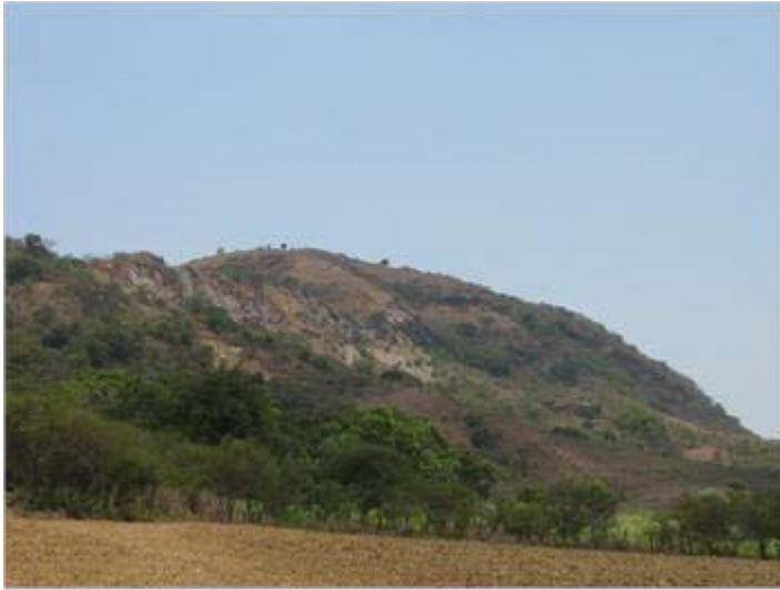
Panorámica del banco de mármol Padilla en Tuxpan, Jalisco.