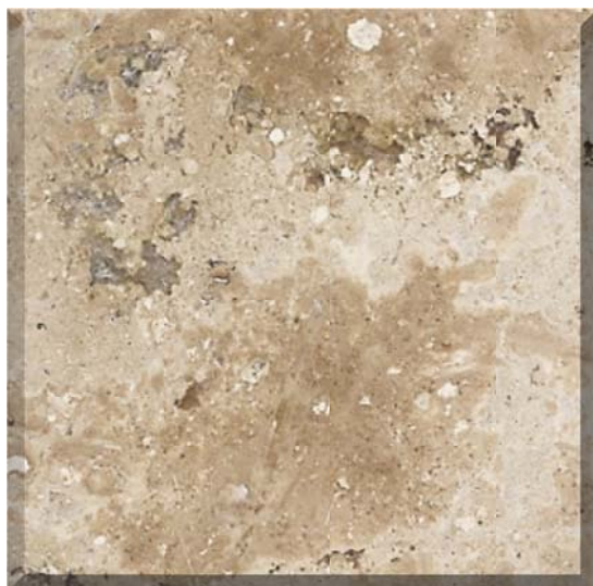
Mosaico que muestra las buenas características físicas de corte, brillo y pulido.