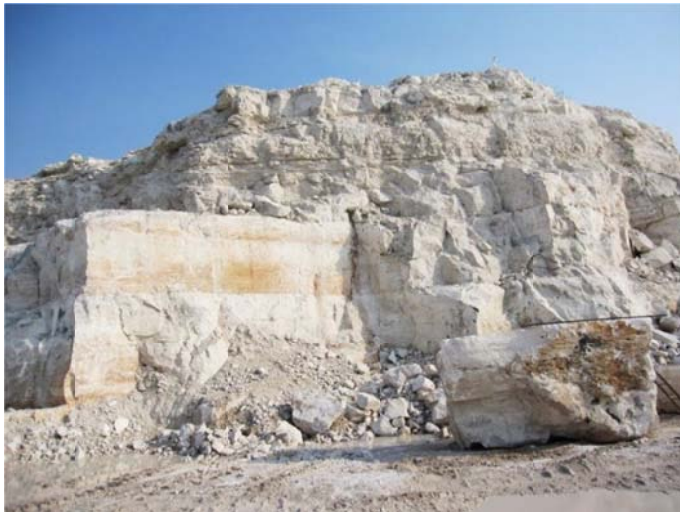
Bloques de travertino color marrón (beige intermedio) y cantera de extracción de la localidad Marmex 2.