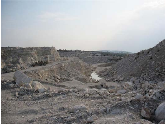
Extenso afloramiento de travertino de la localidad Marmex 2, Municipio de Tepexi de Rodríguez, Pue.