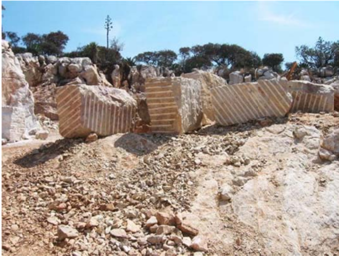
Bloques de mármol amarillo listos para embarque de la localidad Los Hernández. Mpio. Cadereyta, Querétaro.