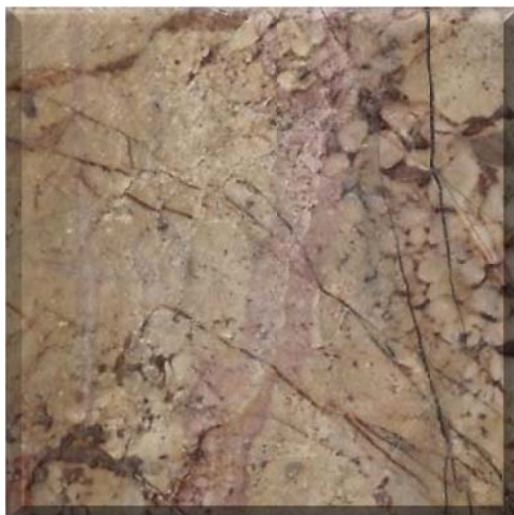
Mosaico que muestra las propiedades físicas de corte, brillo y pulido distintivas de la muestra.