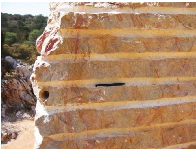
Detalle del mármol amarillo de la localidad Los Hernández. Mpio. Cadereyta, Querétaro.