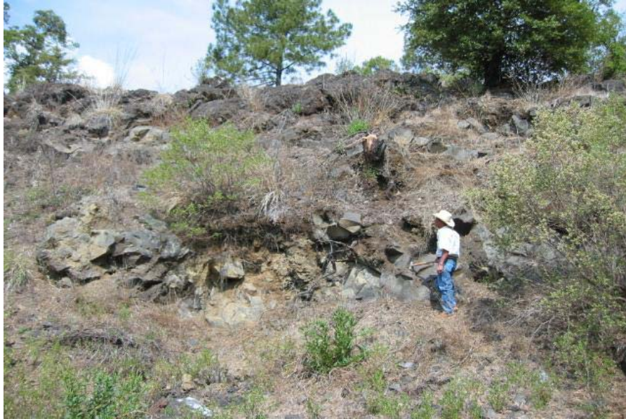
Colada de basalto vesicular color negro en la localidad Loma Larga