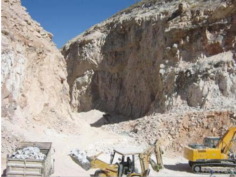
Panorámica de la cantera Lomas, del Ejido La Mina Municipio Lerdo Durango.