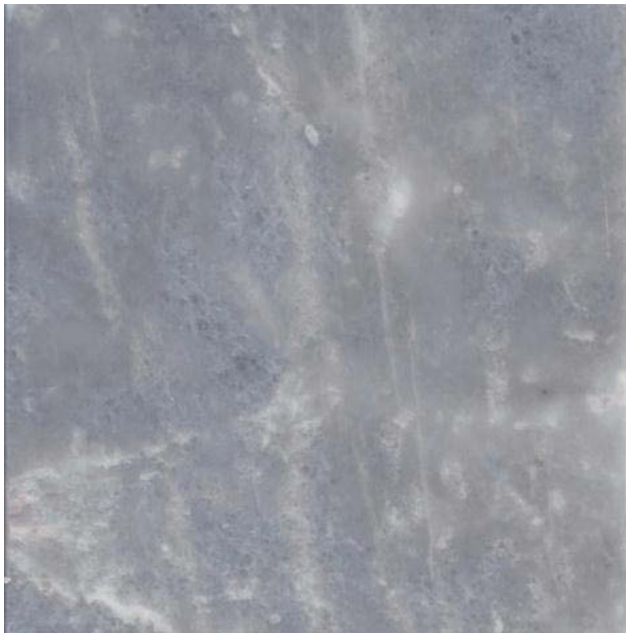
Mosaico pulido de la cantera Lomas, Municipio Lerdo, Durango. Otra buenas características físicas de corte, brillo y pulido.