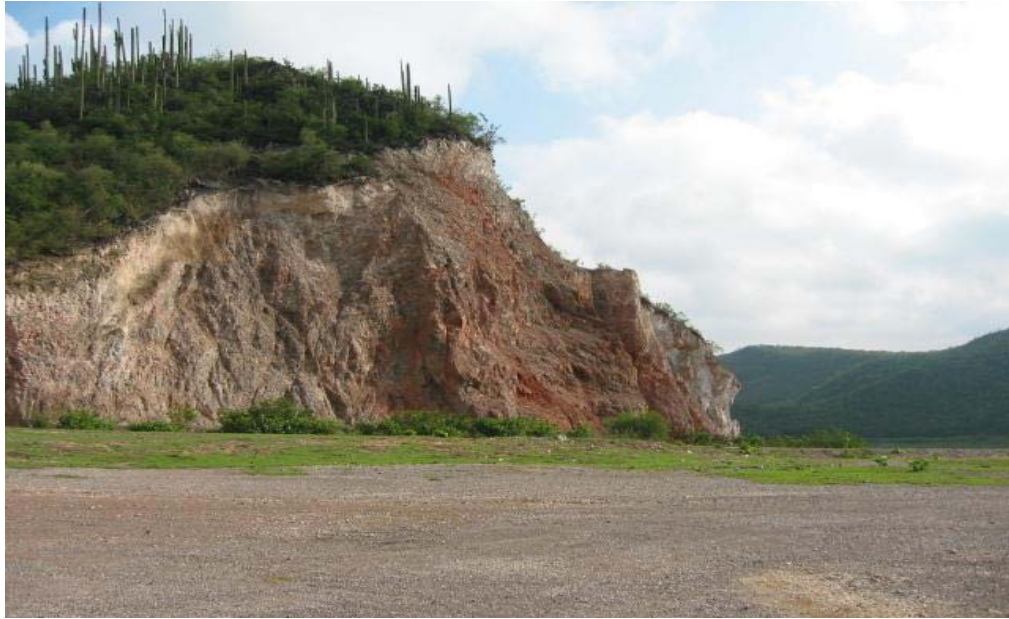
Tajo de materiales de la localidad La Herradura, en la que se produce grava y arena triturada y cribada a partir de la roca.