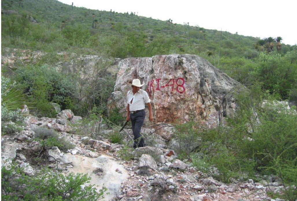
Proyecto La Borrada. Vista del lugar donde aflora el cuerpo principal de ónix. Las capas continúan a ras de piso.