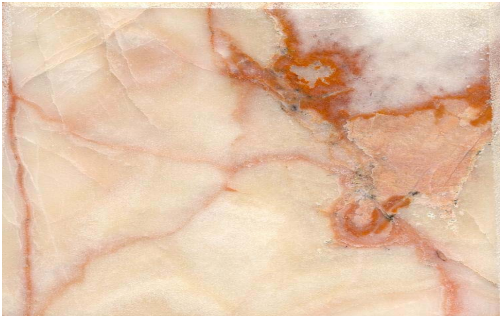
Placa de ónix de la localidad La Borrada. La superficie pulida presenta ligero aspecto coloforme, surcado de líneas rojizas.