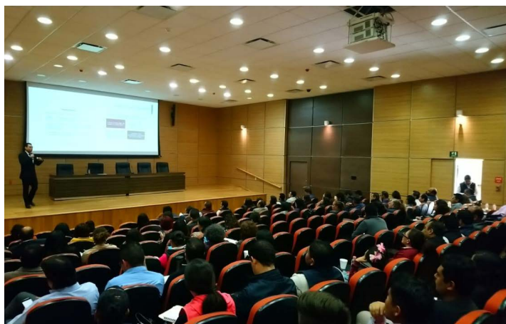
* Capacitación a funcionarios municipales del estado de Hidalgo.