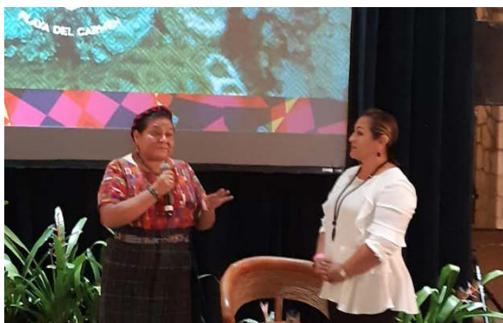
* Encuentro de alcaldes AALMAC.

9. Nos reunimos con el CONEVAL, INDESOL y la Agencia Alemana GIZ-gmbh para colaborar de manera estrecha a fin de que los municipios del país cuenten con herramientas prácticas para la toma de decisiones y planeación que abonen al cumplimiento de la Agenda 2030 y sus ODS.