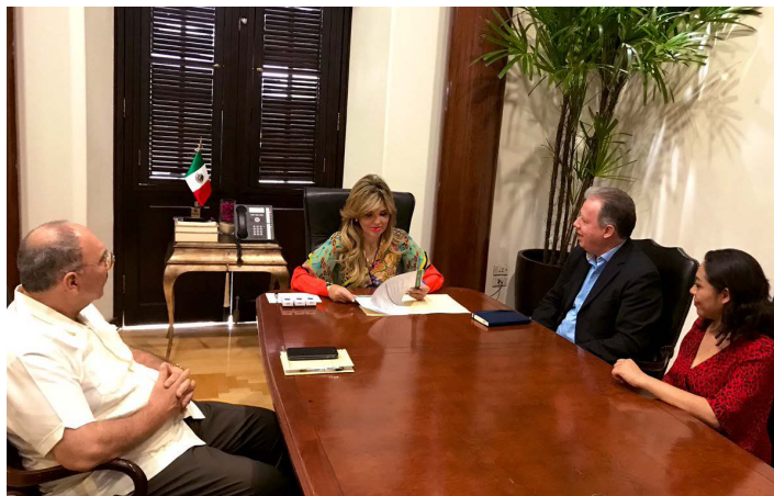
* Reunión con Gobernadora de Sonora.