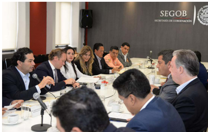
* Segunda reunión de Alcaldes en Gobernación.