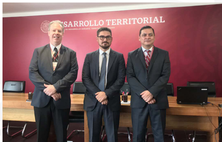
* Reunión con el secretario de SEDATU.