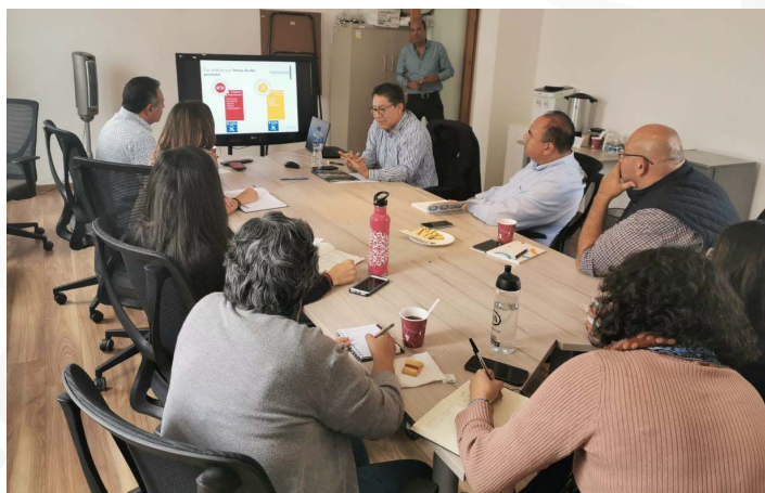
* Reunión con servidores públicos del municipio de Querétaro.

6. Nos reunimos con autoridades y servidores públicos del gobierno municipal de Querétaro, para abordar temas relacionados con nuestra Guía Consultiva de Desempeño Municipal y su posible integración a la misma, con la finalidad de fortalecer su gestión de gobierno.