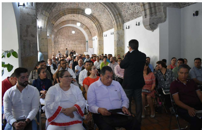
* Capacitación a IES de Jalisco.

3. Brindamos capacitación sobre la Guía Consultiva de Desempeño Municipal a académicos de las Instituciones de Educación Superior del estado de Jalisco, que participarán como instancias revisoras de los resultados municipales durante el proceso de la GDM.