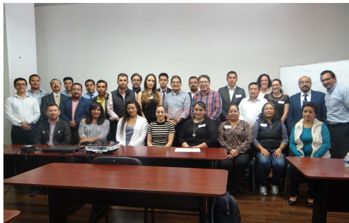
* Reunión con funcionarios del estado de Puebla.

10. Nos reunimos con el nuevo titular del Programa de Desarrollo Social Municipal del estado de Puebla, con el objetivo de generar lazos de colaboración en favor del fortalecimiento de los municipios de ese estado.