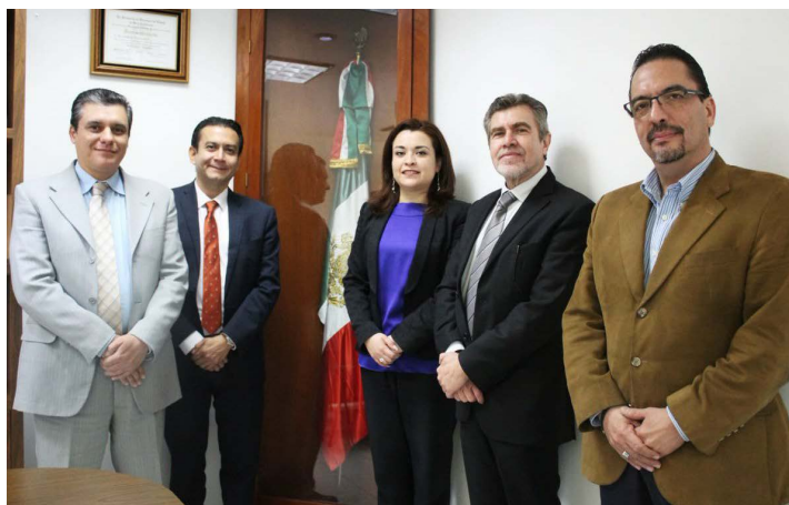
* Reunión con personal del INDETEC.

3. Brindamos capacitación sobre la Guía Consultiva de Desempeño Municipal a académicos de las Instituciones de Educación Superior del estado de Jalisco, que participarán como instancias revisoras de los resultados municipales durante el proceso de la GDM.