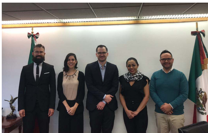
* Reunión con personal de la Agencia Alemana GIZ.

5. Importante reunión de trabajo entre el INAFED y el equipo de la Iniciativa Agenda 2030 de la Agencia Alemana GIZ, para generar esquemas de colaboración a fin de fortalecer la difusión e implementación de los Objetivos de Desarrollo Sostenible en los Municipios de México.