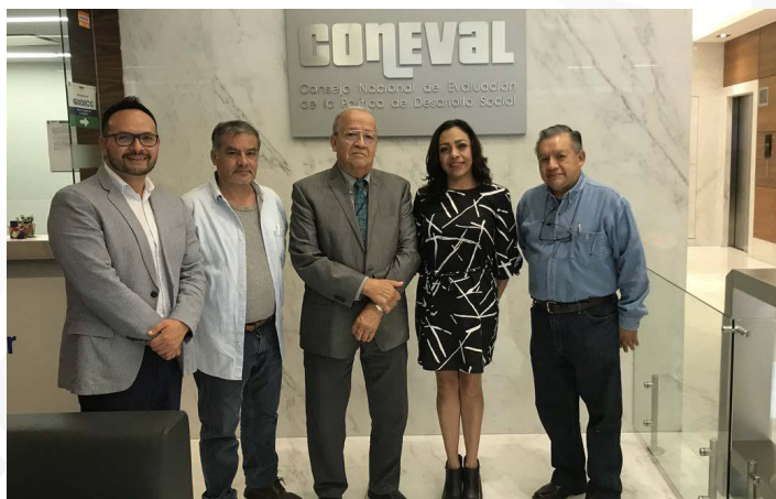
* Reunión con el CONEVAL, INDESOL y la Agencia Alemana GIZ.

9. Nos reunimos con el CONEVAL, INDESOL y la Agencia Alemana GIZ-gmbh para colaborar de manera estrecha a fin de que los municipios del país cuenten con herramientas prácticas para la toma de decisiones y planeación que abonen al cumplimiento de la Agenda 2030 y sus ODS.