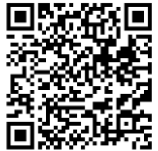
Infografía CENAPRED: “Qué onda con el calor”