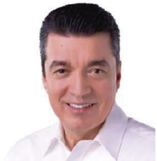
Rutilio Escandón Cadenas Gobernador Constitucional del Estado de Chiapas