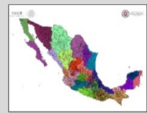
REGIONALIZACIÓN División de tu estado

Validez del boletín: domingo, 20 de octubre de 2019 / 17:00 h