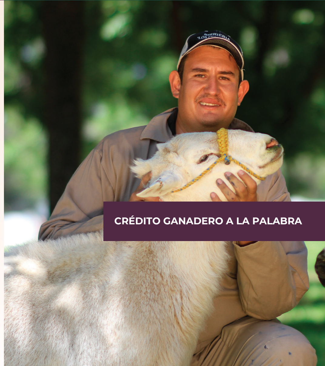
CRÉDITO GANADERO A LA PALABRA

El beneficiario elige a la vaquilla y/o semental , lo que asegura la máxima transparencia y satisfacción.