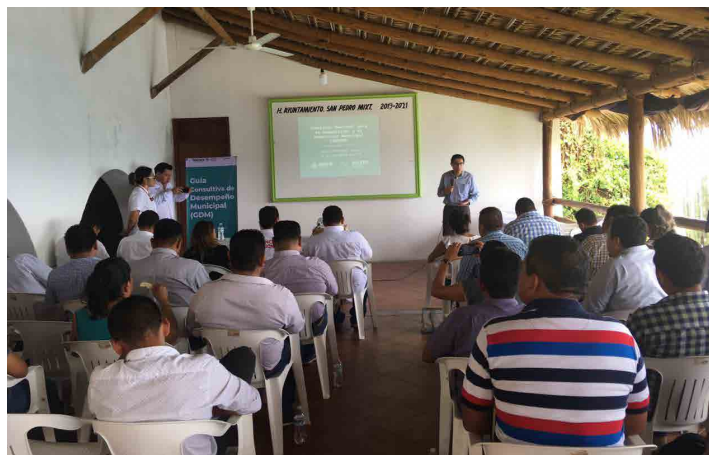
* Taller para la implementación de la GDM en el estado de Oaxaca.

10. En colaboración con el Comité Estatal de Planeación para el Desarrollo y la Coordinación General de Atención Regional del gobierno de Oaxaca, llevamos a cabo el Taller para la implementación de la Guía Consultiva de Desempeño Municipal, al que asistieron presidentas, presidentes y servidores públicos de 17 municipios de la región de la Costa.