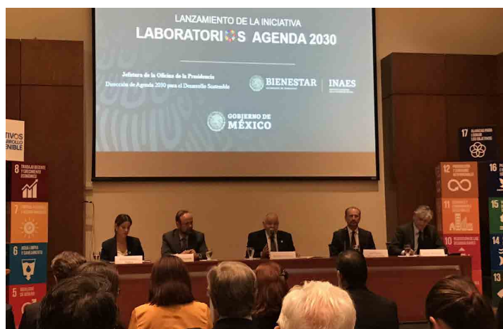
* Lanzamiento de la iniciativa Laboratorio Agenda 2030.