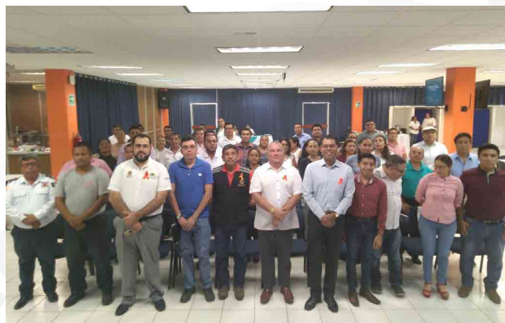
* Taller de Marco Lógico para la Elaboración de Proyectos y Diseño de Indicadores para la Evaluación de la Gestión Municipal en Quintana Roo.

12. En coordinación con la Secretaría de Finanzas y Planeación, del Gobierno del estado de Quintana Roo, impartimos el Taller de Marco Lógico para la Elaboración de Proyectos y Diseño de Indicadores para la Evaluación de la Gestión Municipal a municipios quintanarroenses.