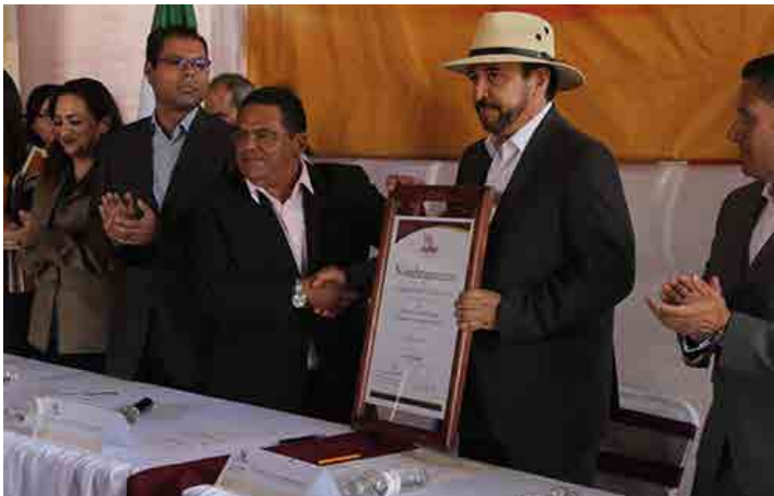
* Toma de protesta del presidente de la Red Nacional de Municipios en Situación Migratoria.

3. Participamos en el Taller para municipios sobre el ciclo de vida de proyectos urbanos con enfoque de sostenibilidad ambiental y Cambio Climático en la Secretaría de Medio Ambiente y Recursos Naturales (SEMARNAT), organizado con el Banco Interamericano de Desarrollo.