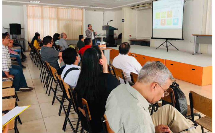
* Jornada de trabajo en el estado de Chiapas sobre la Agenda 2030.

1. Participamos en la jornada de trabajo que se llevó a cabo en el estado de Chiapas, sobre el diseño de políticas públicas apegadas a la Agenda 2030 de los Objetivos de Desarrollo Sostenible propuesta por la ONU en 2015 y que México ha ratificado.