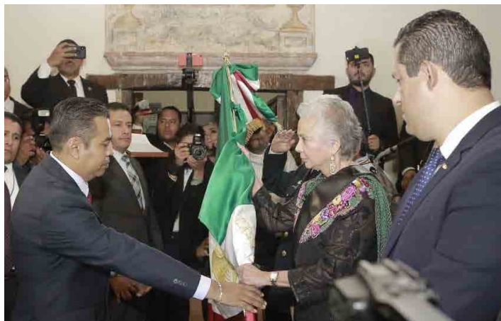
* Ceremonia del grito de Independencia en Dolores Hidalgo, Guanajuato.