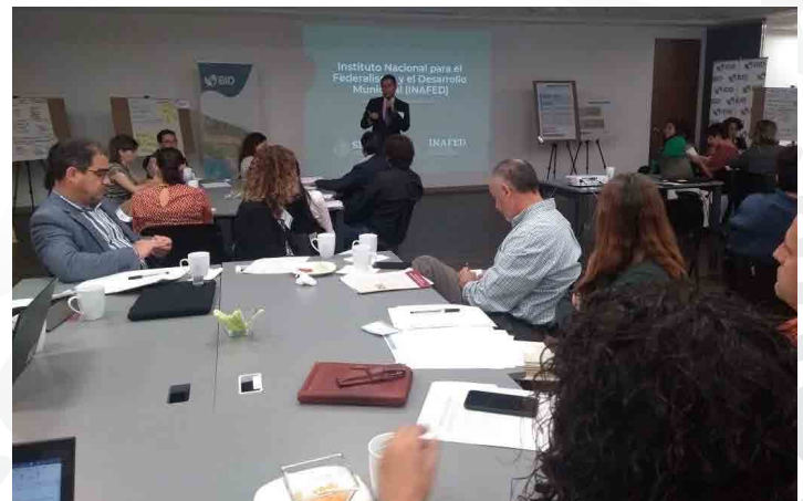
* Taller para municipios organizado con el Banco Interamericano de Desarrollo.

3. Participamos en el Taller para municipios sobre el ciclo de vida de proyectos urbanos con enfoque de sostenibilidad ambiental y Cambio Climático en la Secretaría de Medio Ambiente y Recursos Naturales (SEMARNAT), organizado con el Banco Interamericano de Desarrollo.