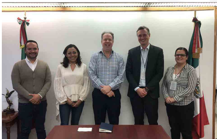
* Redes de Aprendizaje para proyectos en materia de Eficiencia Energética.

6. En colaboración con la Sociedad Alemana para la Cooperación Internacional GIZ GmbH, participamos en las Redes de Aprendizaje para desplegar a nivel municipal proyectos en materia de Eficiencia Energética y abonar juntos al cumplimiento de los ODS de la Agenda 2030.