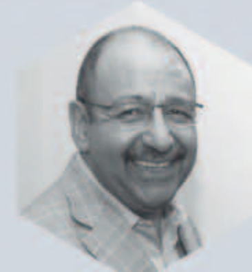
MODERADOR Ing. Carlos Rojas Gutiérrez

Ex Secretario de Gobernación y Ex Gobernador del Estado de Oaxaca.