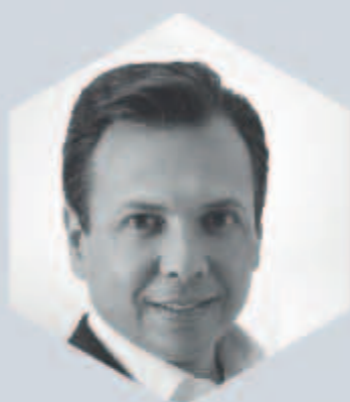
Mtro. Pablo Lemus Navarro

Secretario de Fomento Económico del Estado de Colima.