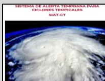
Enlace Manual SIAT-CT SINAPROC