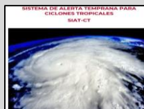
Enlace Manual SIAT-CT SINAPROC