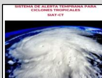
Enlace Manual SIAT-CT SINAPROC