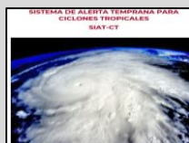
Enlace Manual SIAT-CT SINAPROC