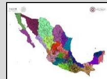
REGIONALIZACIÓN División de tu estado

Validez del boletín: Boletín informativo único.