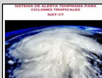
Enlace Manual SIAT-CT SINAPROC