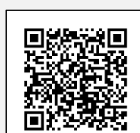
Infografía CENAPRED: "Qué hacer en caso de inundación"