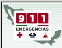
En caso de emergencia marca al 911