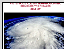
Enlace Manual SIAT-CT SINAPROC