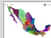
REGIONALIZACIÓN División de tu estado

Validez del boletín: Boletín informativo único.