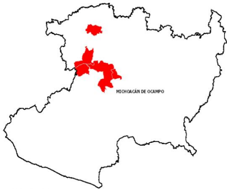
Zona Bajo Control Fitosanitario