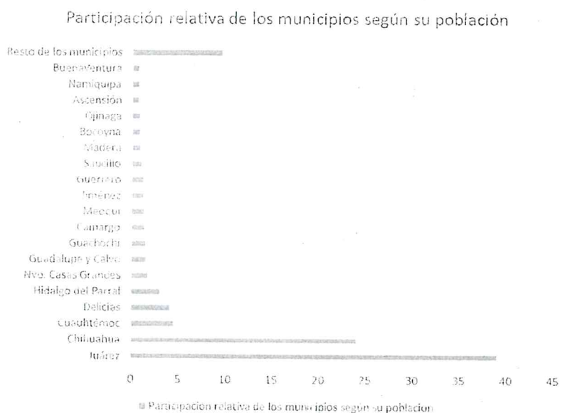
Gráfica 1 Participación relativa de los municipios según su población