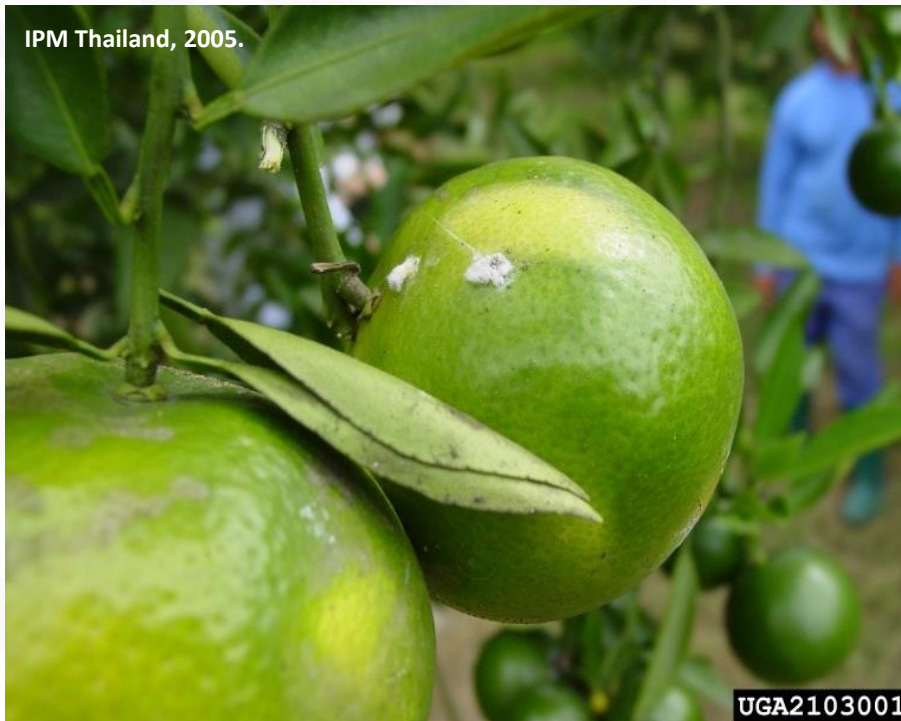
P. minor en tangerina

Se reportan más de 250 especies hospedantes como: cítricos, cacao, café, maíz, vid, mango, papaya, papa, guayaba, plátano, carambolo y soya.