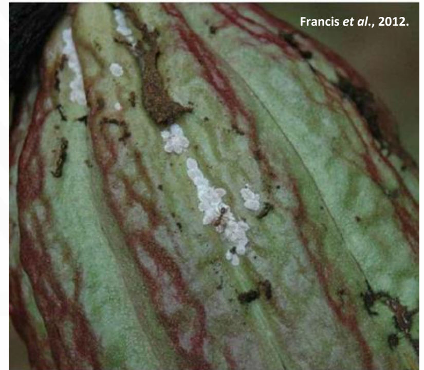
Hembras de P. minor sobre una vaina de cacao