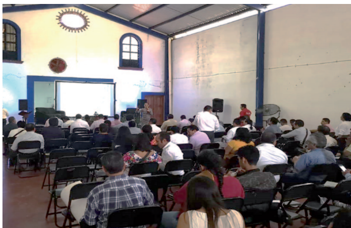
* Encuentro de Información y Capacitación Municipal 2019, en Santa María del Tule, Oaxaca.

6. Para el INAFED el trabajo con las asociaciones municipalistas es fundamental a fin de fortalecer el desarrollo de los gobiernos locales de nuestro país, por tal motivo, nos reunimos con la Asociación Nacional de Alcaldes (ANAC), la Asociación de Autoridades Locales de México (AALMAC) y la Asociación de Municipios de México (AMMAC) con el objetivo de generar sinergias en favor de los municipios de México.