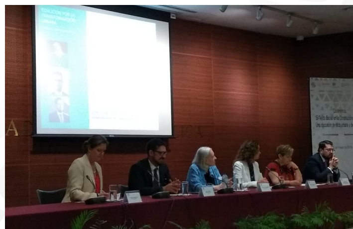
* Conferencia “El tejido social en la construcción de ciudad: Una discusión de ética urbana y desigualdad”.

15. Asistimos a la conferencia “El tejido social en la construcción de ciudad: Una discusión de ética urbana y desigualdad” del evento “Coalición Transformación Urbana”, organizado por el Senado de la República.