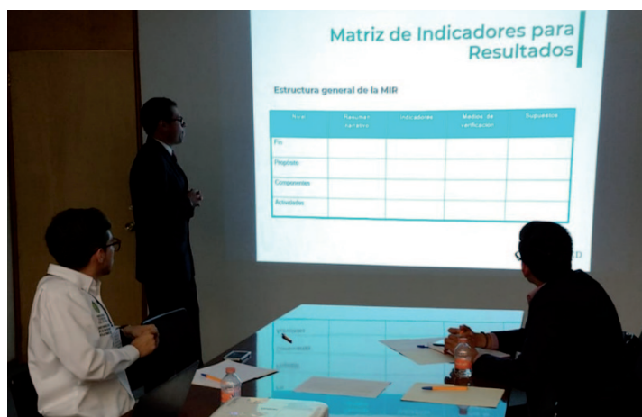
* Capacitación a servidores públicos del Instituto Veracruzano de Desarrollo Municipal.

2. Impartimos capacitación a servidores públicos del Instituto Veracruzano de Desarrollo Municipal en materia de Programas Federales y Elaboración de Proyectos, con el objetivo fortalecer su planeación municipal y que puedan llevar cabo una adecuada gestión de recursos federales.