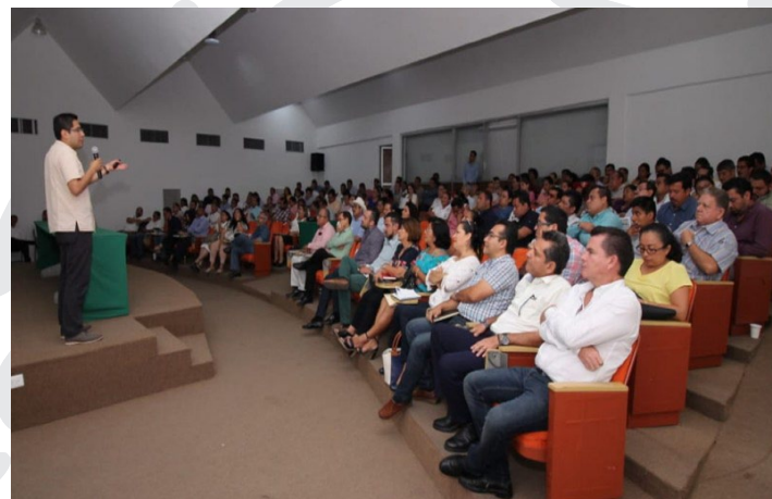
* Brindamos capacitación a servidores públicos municipales de Tabasco.

9. En la Segunda Jornada de Capacitación a servidores públicos municipales del estado de Tabasco, impartimos el taller sobre la “Guía Consultiva para el Desempeño Municipal”, herramienta que busca fortalecer las administraciones públicas locales del país, con la finalidad de que puedan generar mejores condiciones de vida para la población.