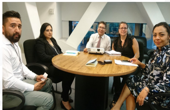
* Reunión de trabajo con servidores públicos del Gobierno de la Ciudad de México.

12. Sostuvimos una reunión de trabajo con servidores públicos del Gobierno de la Ciudad de México con el objetivo de crear sinergias en favor del desarrollo de las 16 alcaldías de la capital del país.