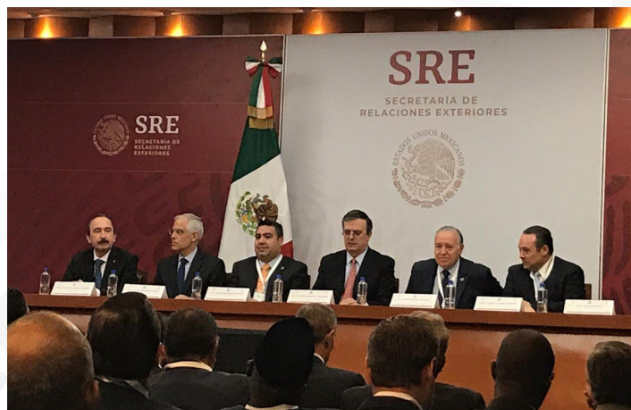
* Reunión de la Asociación Mexicana de Secretarios de Desarrollo Económico con el Cuerpo Diplomático acreditado en México.

3. Asistimos a la Reunión de la Asociación Mexicana de Secretarios de Desarrollo Económico con el Cuerpo Diplomático acreditado en México, que busca intercambiar información sobre proyectos específicos regionales para promocionarlos en el exterior.