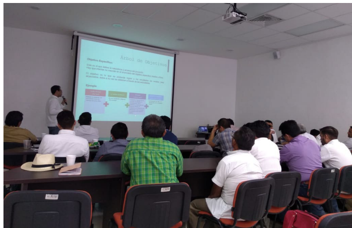
* Brindamos capacitación a servidores públicos municipales de Yucatán.

4. Brindamos capacitación a servidores públicos municipales del estado de Yucatán en materia de Elaboración de Proyectos, con el objetivo de fortalecer los conocimientos y habilidades de los funcionarios municipales de esa entidad.