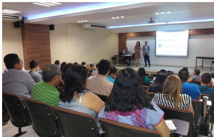
* Capacitación a servidores públicos de Colima

10. Brindamos capacitación a servidores públicos de nueve municipios del estado de Colima con el objetivo de fortalecer sus capacidades en materia de transparencia, elaboración de indicadores e implementación de la Agenda 2030.