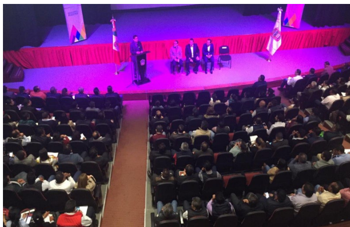
* Brindamos capacitación a servidores públicos municipales de los 66 municipios que conforman el Valle de Toluca.

9. En la Segunda Jornada de Capacitación a servidores públicos municipales del estado de Tabasco, impartimos el taller sobre la “Guía Consultiva para el Desempeño Municipal”, herramienta que busca fortalecer las administraciones públicas locales del país, con la finalidad de que puedan generar mejores condiciones de vida para la población.