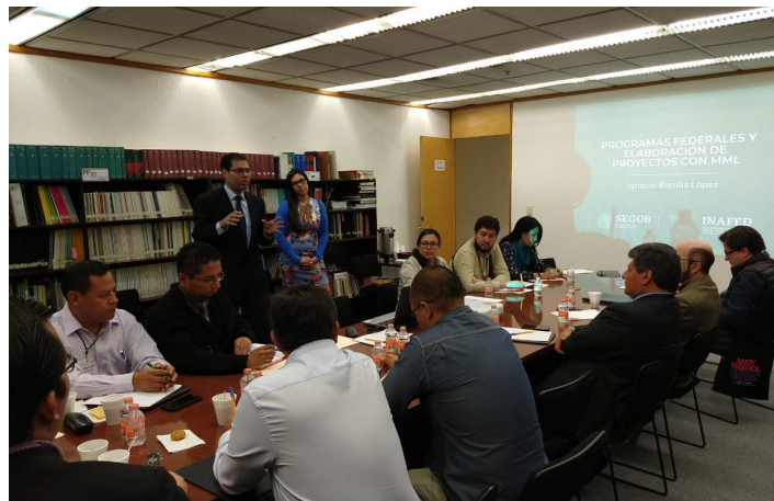
* Brindamos capacitación a servidores públicos de Tlalnepantla de Baz.

1. Brindamos capacitación a servidores públicos del municipio de Tlalnepantla de Baz, Estado de México, sobre Identificación de Proyectos bajo la Metodología de Marco Lógico y Programas Federales, con el objetivo de dotar a los funcionarios del ayuntamiento de información sustantiva que les permita gestionar programas federales en beneficio de la ciudadanía.