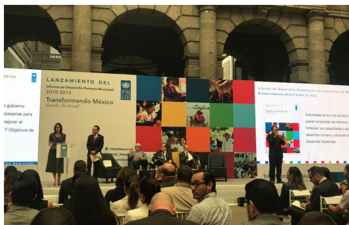
* Presentación del Informe de Desarrollo Humano Municipal 2010-2015, organizado por PNUD.

15. Asistimos a la conferencia “El tejido social en la construcción de ciudad: Una discusión de ética urbana y desigualdad” del evento “Coalición Transformación Urbana”, organizado por el Senado de la República.