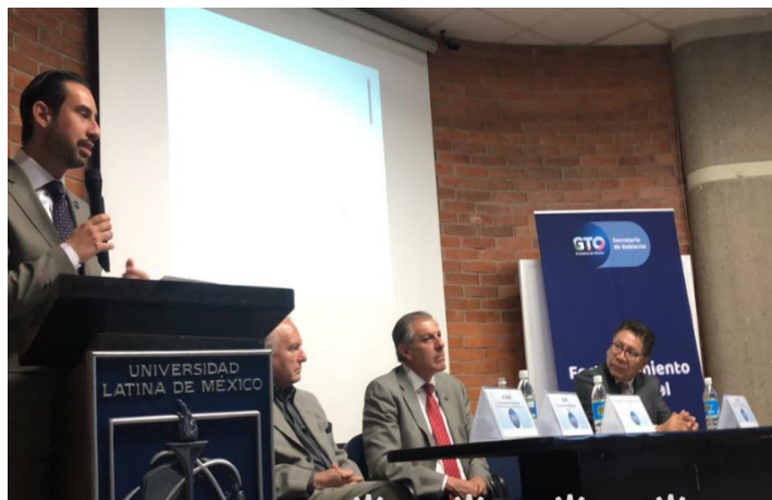
* Reunión con las Instituciones de Educación Superior de Guanajuato.

13. Nos reunimos con las Instituciones de Educación Superior (IES) de Guanajuato que nos apoyarán en la implementación de la “Guía Consultiva de Desempeño Municipal” (GDM) en los municipios de esta entidad.