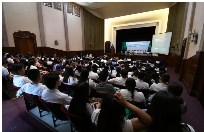
* Foro Municipalista en Zacatecas.

7. Participamos en el “Foro Municipalista” con motivo de la conmemoración de los 500 años de la fundación del primer municipio en México, organizado por la Coordinación Estatal de Planeación del Gobierno de Zacatecas, con el objetivo de analizar el contexto actual del municipio, su visión y su escenario tendencial, así como poner sobre la mesa las posibles rutas de acción que fomenten el logro de condiciones aptas para su desarrollo.