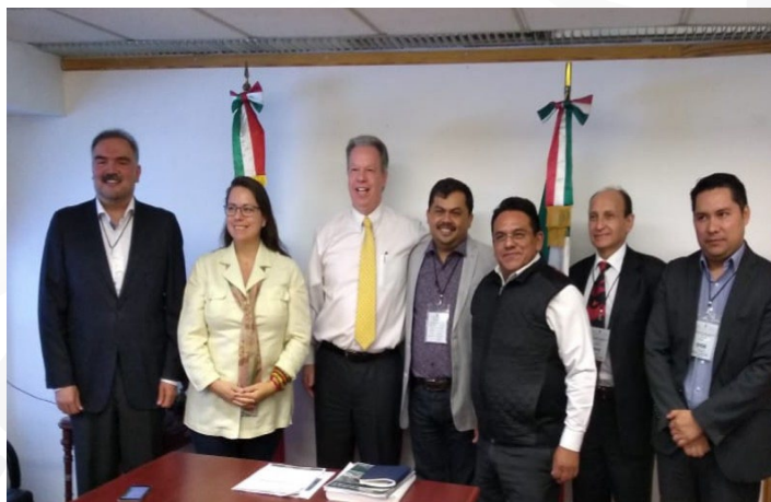
* Reunión con la ANAC, AALMAC y la AMMAC.

6. Para el INAFED el trabajo con las asociaciones municipalistas es fundamental a fin de fortalecer el desarrollo de los gobiernos locales de nuestro país, por tal motivo, nos reunimos con la Asociación Nacional de Alcaldes (ANAC), la Asociación de Autoridades Locales de México (AALMAC) y la Asociación de Municipios de México (AMMAC) con el objetivo de generar sinergias en favor de los municipios de México.