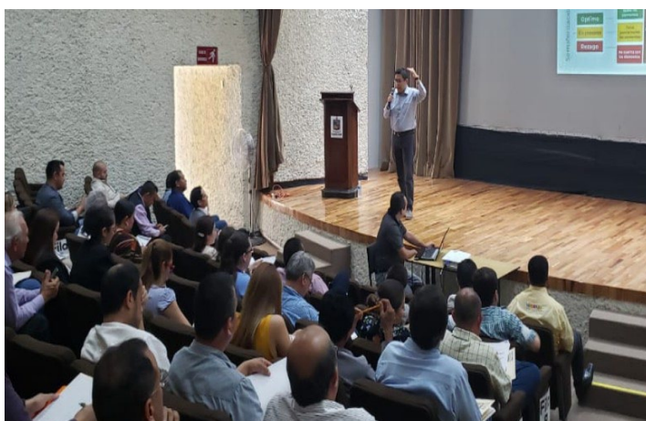
* Capacitación a funcionarias y funcionarios de municipios de Nuevo León.

12. Sostuvimos una reunión de trabajo con servidores públicos del Gobierno de la Ciudad de México con el objetivo de crear sinergias en favor del desarrollo de las 16 alcaldías de la capital del país.