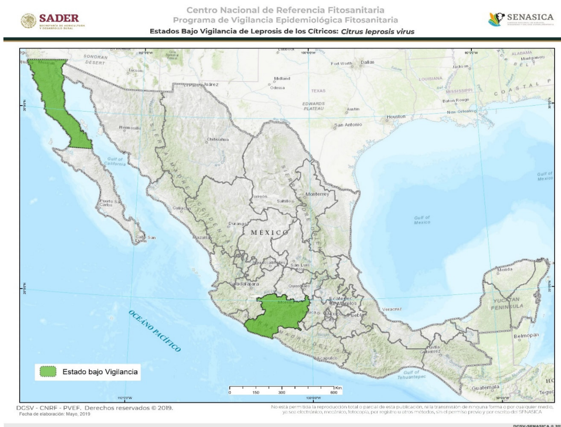
Figura 2. Vigilancia Epidemiológica Fitosanitaria de Citrus leprosis virus . Elaboración propia con datos de SAGARPA-SENASICA-PVEF, 2017b y SENASICA, 2019.

En el presente año, la vigilancia de esta plaga se lleva a cabo en dos estados: Baja California y Michoacán (SAGARPA-SENASICA-PVEF, 2019b) (Figura 2), mediante la (SADER-SENASICA-PVEF, 2019). Por lo anterior, y de acuerdo con la Norma Internacional para Medidas Fitosanitarias No.8, el estatus de Citrus leprosis virus es Presente : sólo en algunas áreas sembradas con cultivos hospedantes, sujeta a control oficial, por lo que de acuerdo con la NIMF No. 5, Glosario de términos fitosanitarios cumple con la definición de plaga cuarentenaria, ya que puede potencialmente causar pérdidas económicas en cultivos hospedantes (IPPC, 2019a).