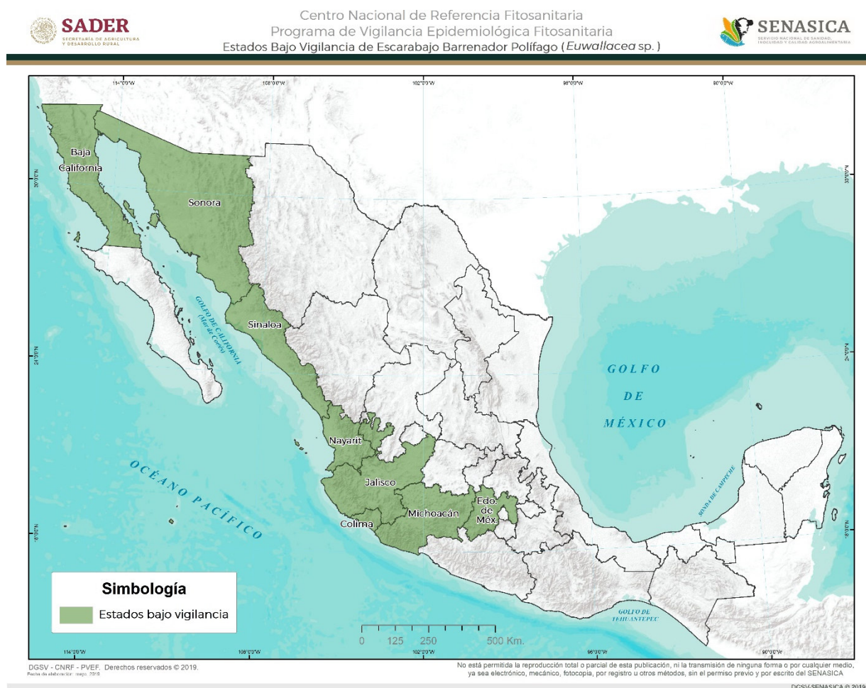
Figura 2. Vigilancia Epidemiológica Fitosanitaria para Euwallacea sp. en México Elaboración propia con datos de SADER-SENASICA-PVEF, 2019b.

En el presente año, las acciones para la vigilancia de Euwallacea sp. incluye las estrategias de área de exploración, exploración puntual, rutas de vigilancia y rutas de trampeo, implementadas en los estados de Baja California, Colima, Jalisco, Estado de México, Michoacán, Nayarit, Sinaloa, Sonora, (Figura 2) (SADER-SENASICA-PVEF, 2019b) en huertos comerciales de aguacate y zonas identificadas como de mayor riesgo, así como la revisión periódica de plantas centinela en puntos de ingreso del territorio nacional (SADER-SENASICA-PVEF, 2019b).