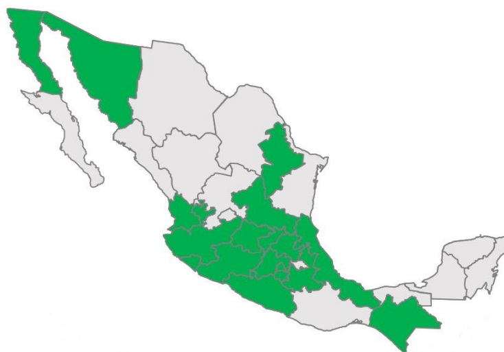
Figura 2. Estados donde se realiza actualmente la vigilancia epidemiológica de Xylella fastidiosa subsp. multiplex en México. Elaboración propia con datos de SAGARPA-SENASICA-PVEF, 2019.

exploración (IPPC, 2011b). En el presente año, el Programa de Vigilancia Epidemiológica Fitosanitaria para X. fastidiosa subsp. multiplex se está llevando a cabo en los estados de Baja California, Colima, Chiapas, Ciudad de México, Guanajuato, Guerrero, Hidalgo, Jalisco, Estado de México, Michoacán, Morelos, Nayarit, Nuevo León, Puebla, Querétaro, San Luis Potosí, Sonora y Veracruz (Figura 2) (SAGARPA-SENASICA-PVEF, 2019), mediante las estrategias de vigilancia Área de exploración, Ruta de vigilancia y Exploración puntual (SAGARPA-SENASICA-PVEF, 2019).