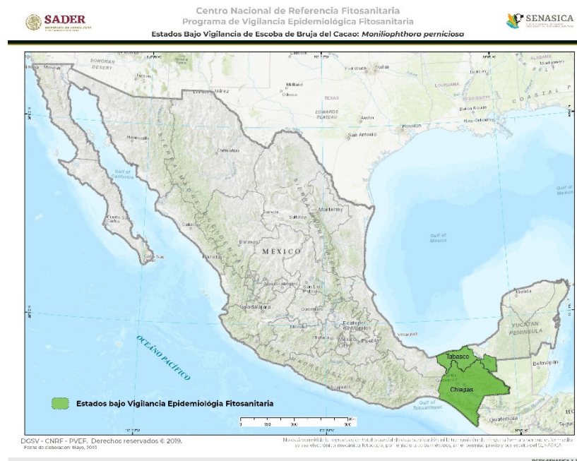
Figura 2. Vigilancia Epidemiológica Fitosanitaria para Moniliophthora perniciosa . Elaboración propia con datos de SADER-SENASICA-PVEF, 2019b.