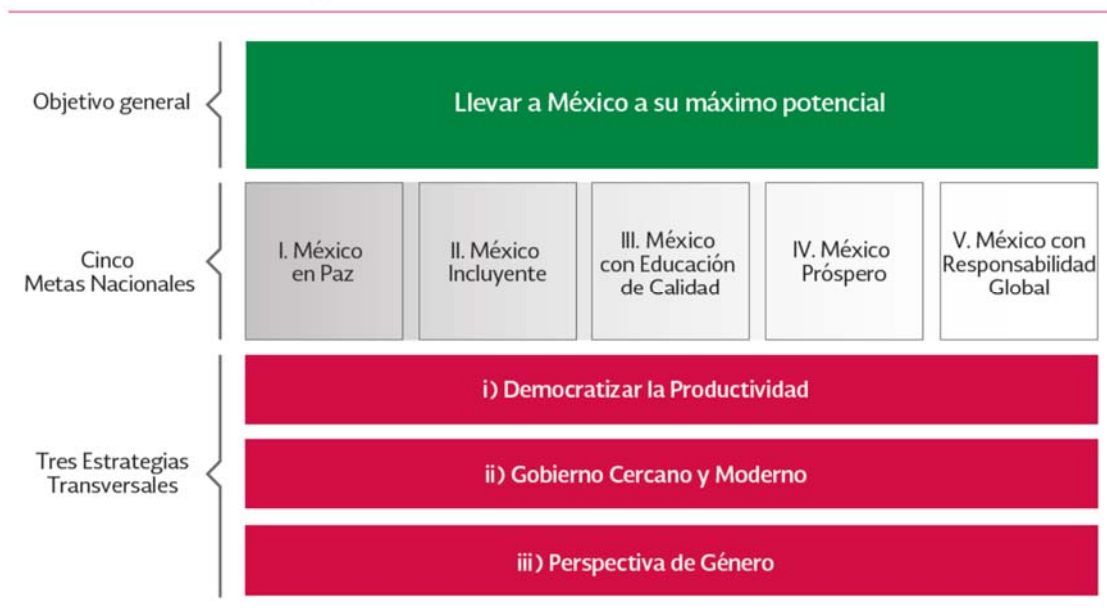
FIGURA I.1. ESQUEMA DEL PLAN NACIONAL DE DESARROLLO 2013-2018.

El Plan Nacional de Desarrollo destaca la importancia de acelerar el crecimiento económico para construir un México Próspero . Detalla el camino para impulsar a las pequeñas y medianas empresas, así como para promover la generación de empleos. También ubica el desarrollo de la infraestructura como pieza clave para incrementar la competitividad de la nación entera. Asimismo, identifica las fortalezas de México para detonar el crecimiento sostenido y sustentable, con el objeto de hacer que nuestro país se convierta en una potencia Económica emergente.